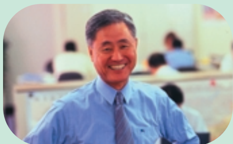
株式会社日本製紙グループ本社 代表取締役社長