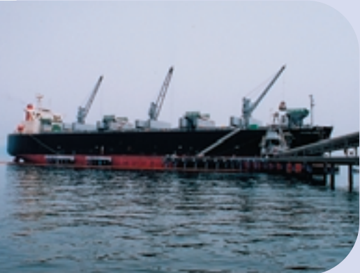
岩国工場専用停泊所にて荷降ろし作業中のチップ船