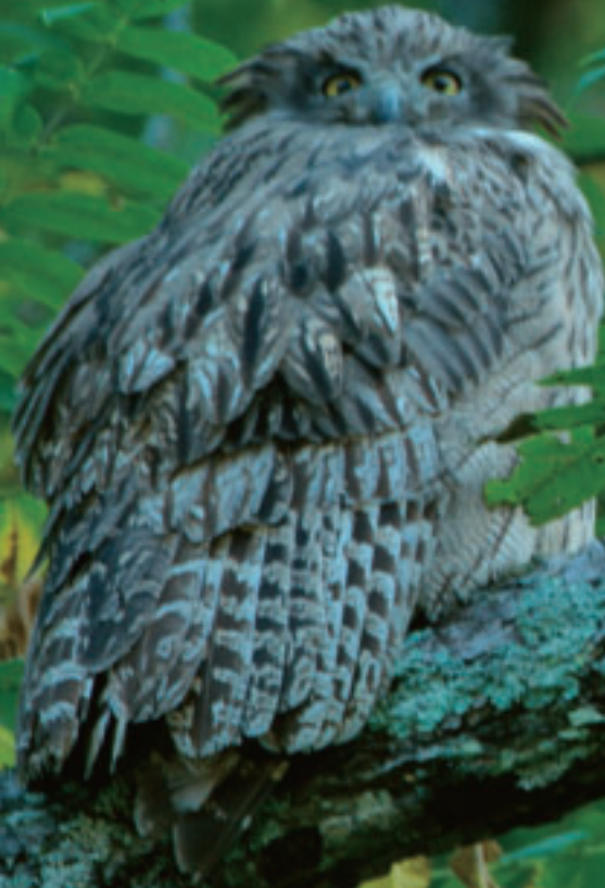
写真:シマフクロウ

現在、地球上では多くの生物が絶滅の危機に瀕しています。すでに滅んだ種も多数あり、その絶滅のスピードについては複数の説が存在します。中には「年間4万種」、つまり、13分ごとにひとつの種が絶滅しているというにわかに信じがたい説もあるほど、我々の想像を超えて地球は傷ついています。今、生物を守るために何ができるのか。日本製紙グループの生物多様性への取り組みをご紹介します。