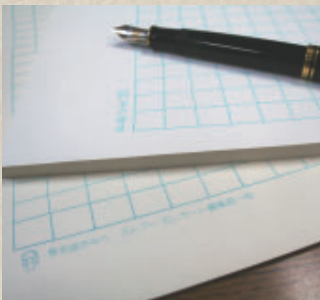
椎名さん愛用の原稿用紙とモンブランの万年筆。現在使っている原稿用紙は3代目。2代目の原稿用紙は作家として独立する際、同僚から譲別にもらったもので「椎名誠さんへ、ストアースレポ」編集部「同」の文字が印刷されている。

1944年東京都生まれ。1979年より、小説、エッセイ、ルポ等の作家活動に入る。主な著作に『犬の系譜』（講談社）、『アド・バード』（集英社）、『黄金時代』（文藝春秋）などがある。最新刊は『らくだの話—そのほか』（本の雑誌社）、『たきびをかこんだ がらからどん』（小学館）。旅の本も数多く、モンゴルやパタゴニア、シベリアなどへの探検・冒険ものを著している。