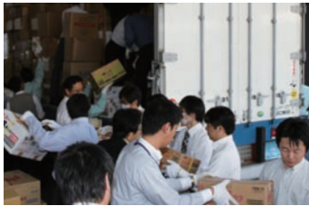
緊急支援物資の積み込み(当社本社)

※ 支援物資：食料、飲料水、発電機、毛布、防寒着、紙おむつ、粉ミルク、カセットコンロ、ストーブ、漫画や書籍など