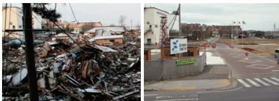
日本製紙(株)石巻工場正門前 被災直後(左)と現在の様子(10月5日)(右)

工場を比較的早期に再開できた要因は、現場の力に尽きます。工場の従業員、協力会社、そして設備メーカーなどの多くの方が、余震の続く現地で作業にあたってくださいました。また、グループの他工場からの応援もかなりの人数に上り、例えば石巻工場では、1日に1,800