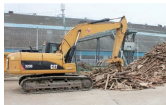
受け入れた瓦礫を再選別