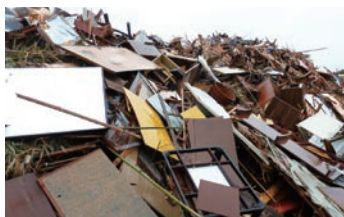
一次集積所で木質瓦礫を選別

日本製紙グループは、木質瓦礫の受け入れや電力供給を通じて、今後も被災地の復興に貢献していきます。