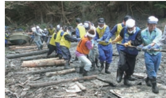
漁具回収作業の様子

日本製紙(株)石巻工場がある石巻市は、震災によって甚大な被害を受けています。「現地へ赴いて復興を支援したい」というグループ従業員の声に応え、日本製紙グループでは東京-石巻間でボランティアバスを運行しました。2011年9月ま