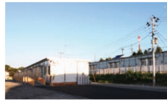
社有地に建設された仮設住宅

日本製紙(株)では、石巻市羽黒町にある社有地約6,000m 2 を、仮設住宅を建設する敷地として、石巻市へ無償貸与してい