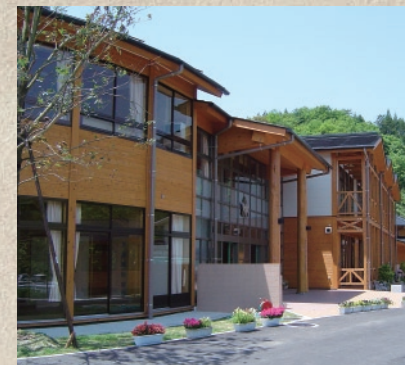
地元の木材を使って建てられた中学校の校舎

木の家は古くなくても廃墟にならないんですよ。子どもたちにその家を渡して、たとえ彼らが建て替えるということで壊しても自然に戻るから環境に優しいんです。大きな超高層ビルとかは別として、一般家庭だったら木造にして、私たちの暮らしの中にももっと木を取り入れていくべきだと思います。そのためには、木の良さをもっと伝えていかないとダメですね。