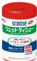
ウェットティッシュ 150枚