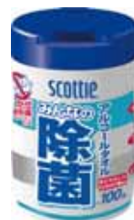
アルコールタオル みんなの除菌 100枚