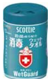
消毒ウェットタオル ウェットガード 80枚