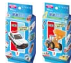
クレシア トミカ除菌ウェットティッシュ 30枚 (絵柄は2種)