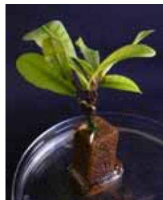
ミラクルフルーツ