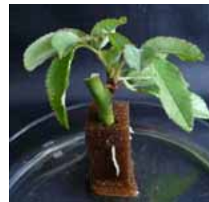
トゲナシノイバラ