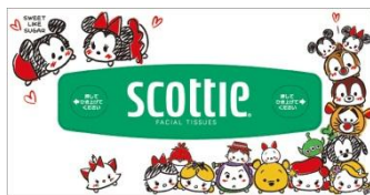
パッケージの天面のデザイン

日常生活に欠かせない身近なアイテムとしてご愛用いただいている『スコッティ®』ブランドのティッシュペーパー。パッケージは、手書き風のイラストで、丸くてかわいい「ディズニー ツムツム」の人気キャラクターが大集合した、明るく楽しいデザインとなっています。