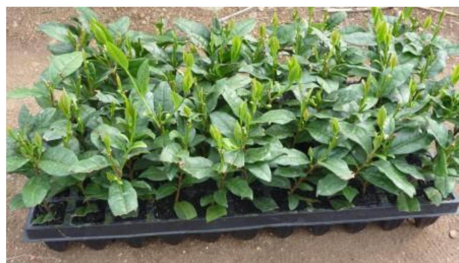
しっかりした根鉢の 状態のセル苗