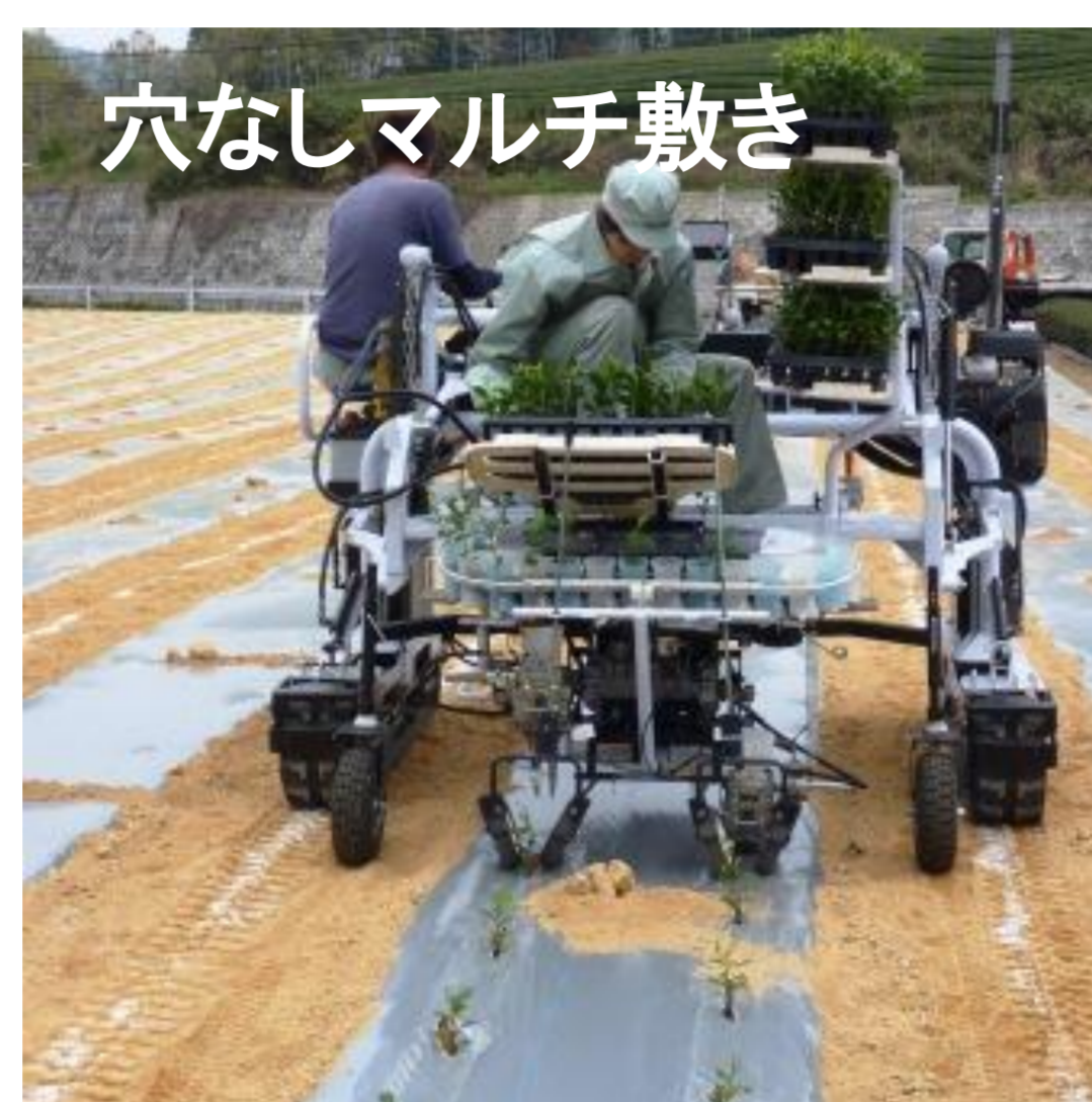
穴なしマルチ敷き