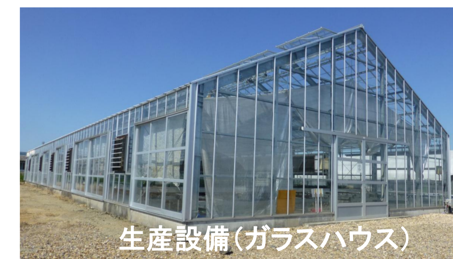
生産設備(ガラスハウス)