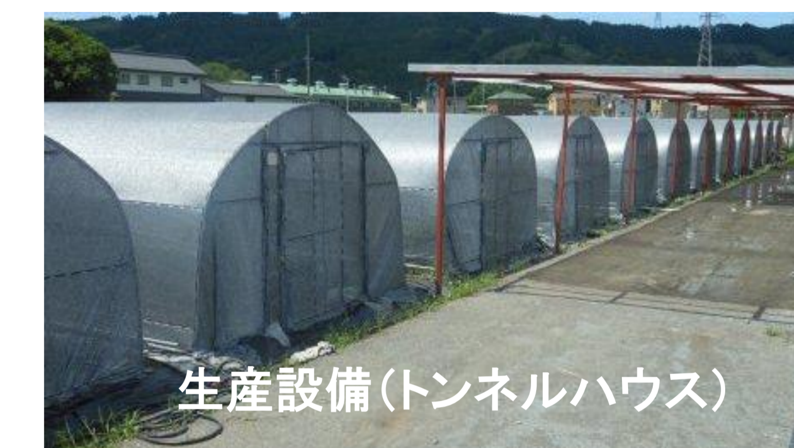
生産設備(トンネルハウス)