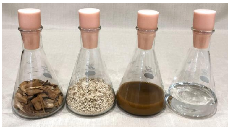
(左から順に) 木材チップ、パルプ、発酵培養液、E2G

航空業界では、脱炭素化に向けた有効な手段の一つとして SAF の社会実装が期待されています。SAF には複数の原料や製造方法があり、現在、世界的には HEFA ※3 技術による SAF 製造が先行しています。しかし、SAF の普及拡大においては原料確保が課題であり、エネルギー安全保障の観点からも原料の多様化が求められています。ATJ は、多様なバイオマスから製造されるアルコールを SAF 原料とすることで、原料の安定調達および多様化に貢献できる技術であり、出光興産はその実証製造に挑戦しています。木質バイオマスに代表される非可食資源由来の国産 E2G を原料とする ATJ-SAF のサプライチェーンが実現すれば、食料との競合を回避しながら、原料生産から製品製造までを国内で完結することが可能です。