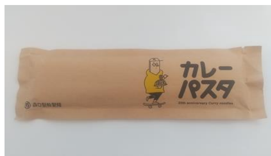
カレーパスタ 森口製粉製麺株式会社

連絡先 日本製紙（株）白板・包装用紙営業本部 包装・産業用紙部 03-6665-5175