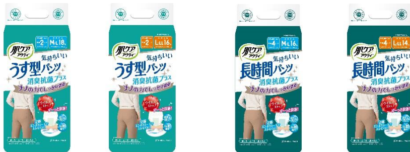
うす型パンツ M-L18枚／L-LL16枚