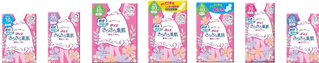
微量用(10cc) / 少量用(20cc) / 安心の少量用(40cc) / 立体ギャザーなし(40cc) / 羽つき(40cc) / 中量用(70cc) / 安心の中量用(100cc)