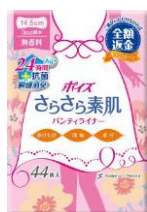
パンティライナー