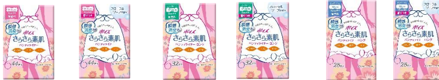
無香料(3cc)／フローラルソープの香り(3cc)／無香料(8cc)／フローラルソープの香り(8cc)／無香料(15cc)／フローラルソープの香り(15cc)