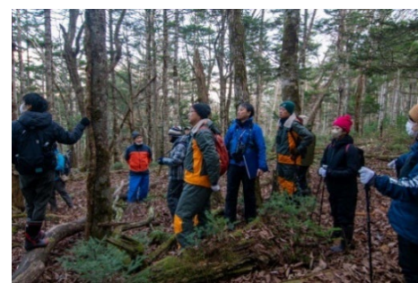
協働での巣箱設置、現地調査のようす