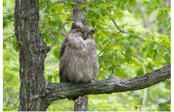
シマフクロウ(絶滅危惧IA類)

* シマフクロウ保護観点から、具体的な場所、地名などの情報は明らかにしていません。