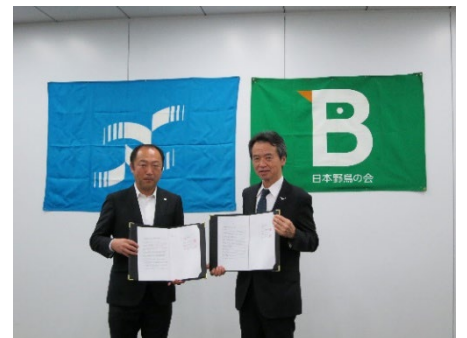
2024年2月に覚書を更新

今回の更新に際し、内容を見直した覚書の対象地の大部分は、日本製紙(株)が通常の木材生産の施業を行なっている森林です。施業を継続しながら、絶滅危惧種の保護を行なうというこの取り組みは、ネイチャーポジティブ時代の新しい生息地保全のあり方を提示するものであり、持続可能な社会を築くうえでの象徴的な事例に位置づけられると考えています。