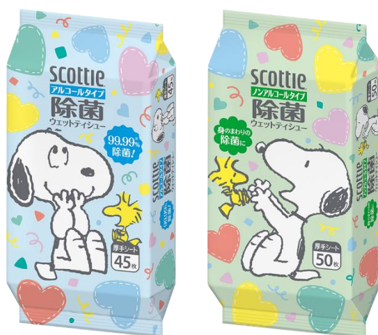
除菌アルコールタイプ

日本製紙グループの日本製紙クレシア株式会社〔住所：東京都千代田区神田駿河台 4-6、代表取締役社長：福島一守〕は、感染対策や衛生管理への意識が高まり、ウェットティッシュを使用する機会が増えている状況の中で、より楽しくお使いいただけるようにと、「Happy スヌーピー」デザインパッケージの『スコッティ® ウェットティッシュ 除菌アルコールタイプ スヌーピー 45枚 / 除菌ノンアルコールタイプ スヌーピー 50枚』を2022年8月5日（金）より数量限定で発売いたします。