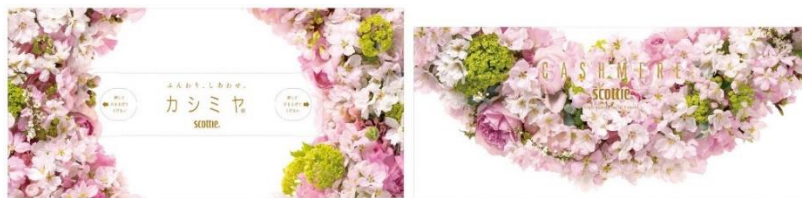
天面／側面のパッケージデザイン

『スコッティ® カシミア』は、シートにローションなどを塗布することなく、独自の加工技術でティッシュ本来の“ふんわり感”を実現したプレミアムティッシュです。