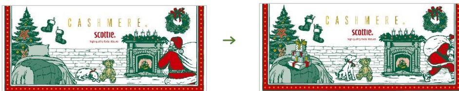
側面のパッケージデザイン

シートにローションなどを塗布することなく、独自の加工技術でティッシュのやわらかさを実感いただけるロングセラー商品『スコッティ® カシミア』。側面のパッケージデザインは、片側にはサンタクロースがプレゼントを持ってきているシーン、もう片側には子どもを起こさないように、プレゼントを置いてこっそり帰るシーンを描きました。