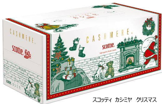
スコッティ カシミア クリスマス

日本製紙グループの日本製紙クレシア株式会社〔住所:東京都千代田区神田駿河台 4-6、代表取締役社長:安永敦美〕は、お家のクリスマスの雰囲気を盛り上げるアイテムとして、『クリネックス®』『スコッティ®』ブランドから、クリスマスシーズンに向けた特別なデザインの『スコッティ® カシミア クリスマス』、『クリネックス® システィ クリスマス』を2024年11月1日より、数量限定で発売いたします。