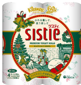
クリネックス システィ クリスマス

当社は、この時期だけのクリスマスモチーフをデザインした、ティッシュやトイレットロールを毎年販売しています。今年は、ティッシュペーパーを日本で発売して60周年。日頃お使いいただいているティッシュやトイレットロールにその歴史を感じていただきたく、親しみ、ぬくもり、ノスタルジーあふれるクリスマスデザインにしました。お家でのパーティーや、のんびりしたりと、クリスマスのお家時間を楽しんでいただけるようなアイテムとしてご用意しています。