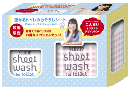
ときめきチェック

日本製紙グループの日本製紙クレシア株式会社〔住所:東京都千代田区神田駿河台 4-6、代表取締役社長:南里泰徳〕は、トイレのお掃除シート『スコッティ® シートウォッシュ for トイレ』のブランドアンバサダーに就任している片づけコンサルタントの近藤麻理恵さん監修デザインの『スコッティ® シートウォッシュ for トイレ コンまりデザイン BOX+つめかえ 2 個セット』を4月1日より数量限定にて発売いたします。