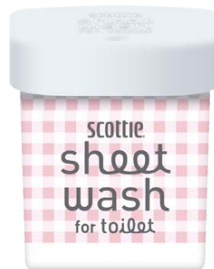
ときめきチェック 本体

今回のパッケージデザインは『スコッティ® シートウォッシュ for トイレ』のブランドアンバサダーに就任している片づけコンサルタントの近藤麻理恵さんに監修をお願いして完成したものです。ピンクのチェック柄の「ときめきチェック」と、グリーンベースのリーフ柄の「ときめきリーフ」の2種類のデザインを数量限定にて発売することになりました。いずれも、特製カートンに本体とつめかえ2個パックが入ったセット商品です。