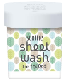
ときめきリーフ 本体