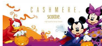
パッケージの側面のデザイン

「スコッティ® カシミア」は、シートにローションなどを塗布することなく、独自の加工技術でティシュー本来の“ふんわり感”を実現しました。タオルのような“ふんわり”とした使い心地のプレミアムティシューです。