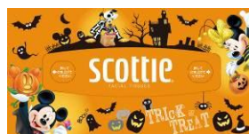
パッケージの天面のデザイン

『スコッティ® ティッシュ』は、『スコッティ®』ブランドのレギュラータイプのティッシュで、ご家庭の身近なアイテムとしてご愛用いただいています。