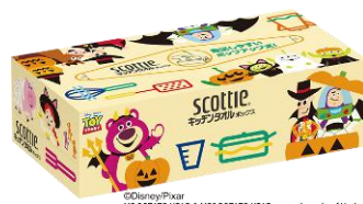
©Disney/Pixar MR.POTATO HEAD & MRS.POTATO HEAD are trademarks of Hasbro used with permission. ©Hasbro. All Rights Reserved. ©Poof-Slinky, LLC. スコッティ® キッチンタオルボックス