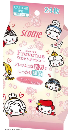
フルーティマスカットの香り

©DISNEY ©Disney. Based on the "Winnie the Pooh" works by A.A. Milne and E.H. Shepard.