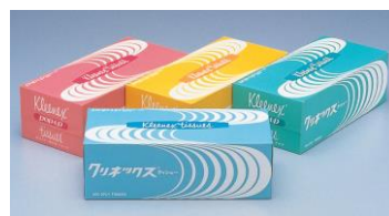
1971年発売当時のパッケージ

当時のテレビコマーシャルでは、天使の姿の少女がティッシュの肌ふれるやわらかさ、取り出しやすさを表現した「天使」編を放送し、1978年「IBA(国際放送広告賞)」を受賞するなど、話題になりました。