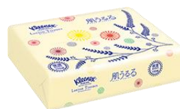
ソフトパック 110 組