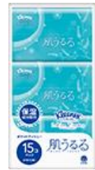
ポケット 15 コパック