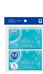
ポケット 4 コパック