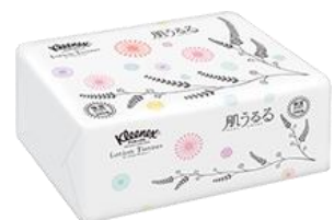
ソフトパック 240 組