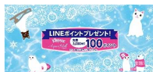
ウィンターデザインには キャンペーンの告知入り