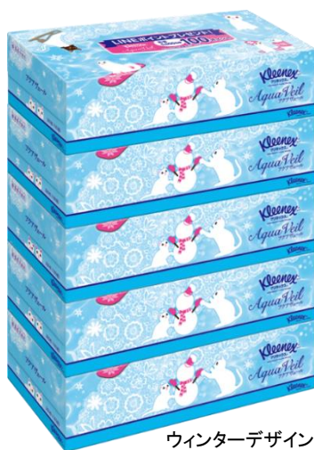
ウィンターデザイン

この度、ウィンターデザインとして、パッケージに、スケート靴に入ったネコやスノーボードをするネコ、雪だるまを作っているネコ等、「冬遊びに夢中なネコ」のモチーフを施した、ウィンターシーズンにぴったりのパッケージデザインを数量限定で発売します。キャンペーンには、ウィンターデザイン、通常品どちらもご応募できます。