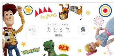
パッケージの天面のデザイン

おもちゃの世界を舞台に、シリーズ史上最大の感動のアドベンチャーに登場している「ウッディ」や「バズ・ライトイヤー」や「エイリアン」など人気キャラクターたちが勢ぞろいのデザインです。