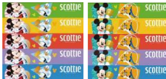
パッケージの長側面のデザイン

ぜひ、この機会に、「ミッキー&フレンズ」スポーツデザインの『スコッティ®』ブランドのティッシュをお楽しみください。