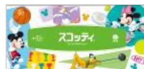
パッケージの天面のデザイン

『スコッティ®ティッシュ』は、『スコッティ®』ブランドのレギュラータイプのティッシュで、ご家庭の身近なアイテムとしてご愛用いただいています。