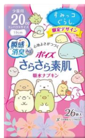
吸水ナプキン 少量用(20cc) 26枚