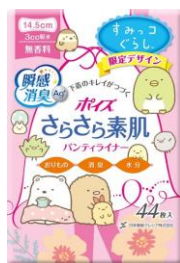
パンティライナー 無香料(3cc) 44枚

日本製紙グループの日本製紙クレシア株式会社〔住所：東京都千代田区神田駿河台 4-6、代表取締役社長：山崎 和文〕は、吸水ケア専用品「ポイズ®さらさら素肌」を、人気キャラクター「すみっこぐらし」デザインで、1月より数量限定で発売致します。また、この限定パッケージについている応募マークを貼りご応募いただいた方の中から抽選で合計 1,000 名様に『すみっこぐらし オリジナルグッズ(3枚コースで風呂敷／1枚コースでポーチ)』をプレゼントします。