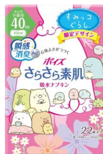
吸水ナプキン 安心の少量用(40cc) 22枚