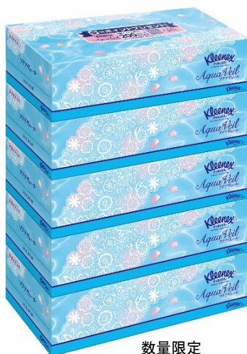
数量限定 スプリングデザイン

この度、スプリングデザインとして、パッケージに桜の花びらが舞うイラストを施し、一足先に春の訪れを感じさせるパッケージデザインを数量限定で発売します。キャンペーンには、スプリングデザイン、通常品どちらも対象商品としていただけます。