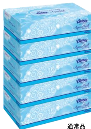
通常品 クリネックスティッシュ アクアヴェール 5箱パック