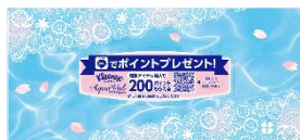
スプリングデザインには キャンペーンの告知入り