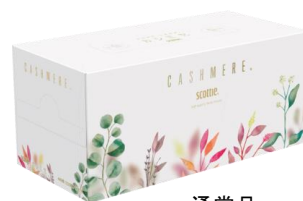
通常品 スコッティ® カシミア ボタニカル