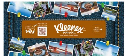
特別ボックスの天面

アメリカで有名な観光スポットを特別ボックスの中にデザインしました。(1)アメリカ自由の女神(2)アンテロープ・キャニオン(3)ホースシューベンド(4)ナイアガラの滝(5)ゴールデン・ゲート・ブリッジ(6)セントラル・パーク(7)ブロードウェイの写真が盛り込まれています